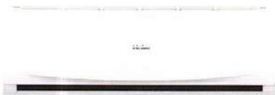
HSU-18CTR 03T ราคา 27,900 บาท

18,177 BTU ขนาด ก x ล x ส (มม.) 1008 x 318 x 225 SEER 13.2