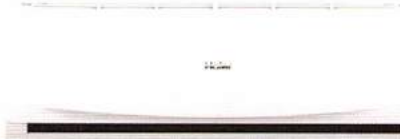
HSU-24CTR 03T ราคา 32,900 บาท

24,095 BTU ขนาด ก x ล x ส (มม.) 1125 x 240 x 335 SEER 14.0