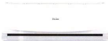
HSU-10CTR 03T ราคา 15,900 บาท

10,238 BTU ขนาด ก x ล x ส (มม.) 865 x 200 x 290 SEER 14.1