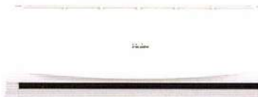
HSU-13CTR 03T ราคา 18,900 บาท

12,665 BTU ขนาด ก x ล x ส (มม.) 865 x 200 x 290 SEER 13.6